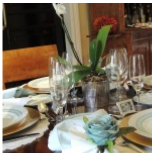
Porcelana Schmidt – Audrey