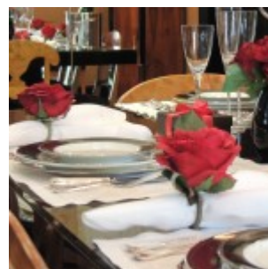
Porcelanas Schmidt – Royal