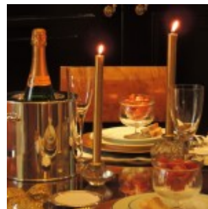
Porcelana Schmidt – Filete Ouro

Capricho que vale a pena – ponto alto é a ceia portanto, sua mesa tem que estar caprichada. Não importa se seu estilo é mais formal, esportivo e colorido, clássico ou super informal como o casal que escolheu enfeitar e comemorar na bancada da cozinha. O importante é que todos sintam no ar que é uma noite especial, que você se importa, sim – com a companhia, e principalmente com a ocasião.