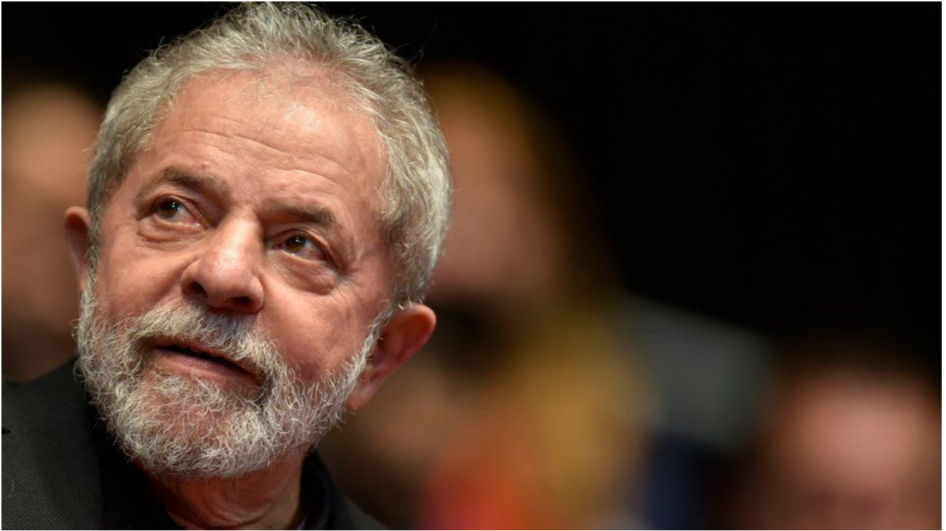
Presidente Lula

O Presidente Lula, tinha uma postura bonachona e dizia que não ligava muito para regras. Mas, esperto, logo percebeu que o cerimonial é um grande aliado da “forma e imagem” – e que a equipe está lá para facilitar. Quebrava o protocolo claro, mas sabia o momento de fazê-lo e jamais o fazia em coisas realmente importantes que comprometessem o evento.