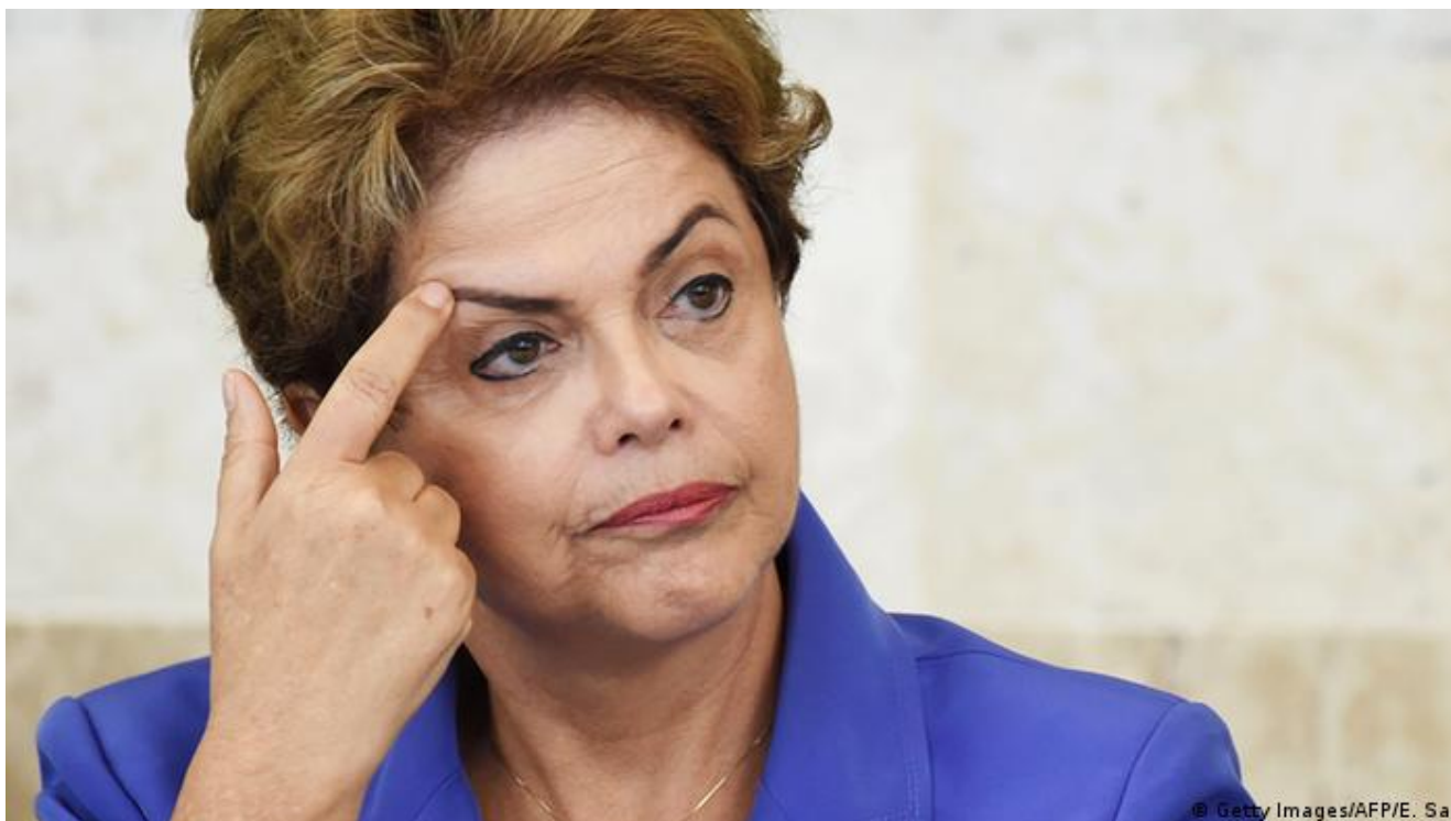
Presidente Dilma Rousseff

Dilma Rousseff, mesmo em repouso, tinha a capacidade deixar a equipe tensa. Jamais entendi isso (não fazia parte de sua equipe, mas assistia atônita). Eventos com ela não eram nossos preferidos.