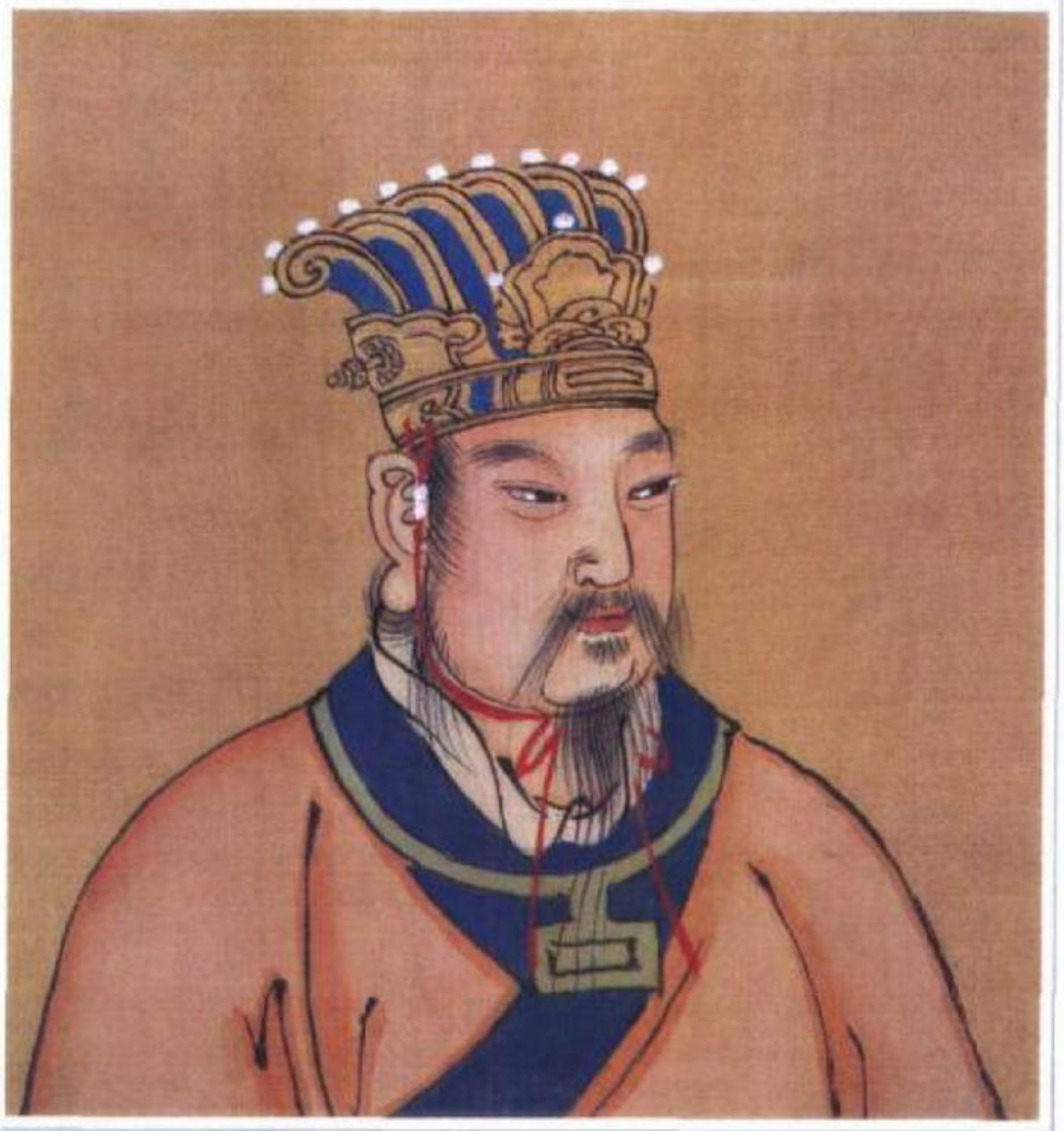
周文王 (? — 前1046) 明人绘

Cerimonial – é a organização sequencial de qualquer evento seja ele político, social, acadêmico, esportivo ou empresarial. E tem sido, desde a antiguidade, uma das mais valorizadas maneiras encontradas pelos povos para se relacionarem uns com os outros. O escrito mais antigo é atribuído a Chou Kung , fundador da dinastia Chou da China no século XII a.C.