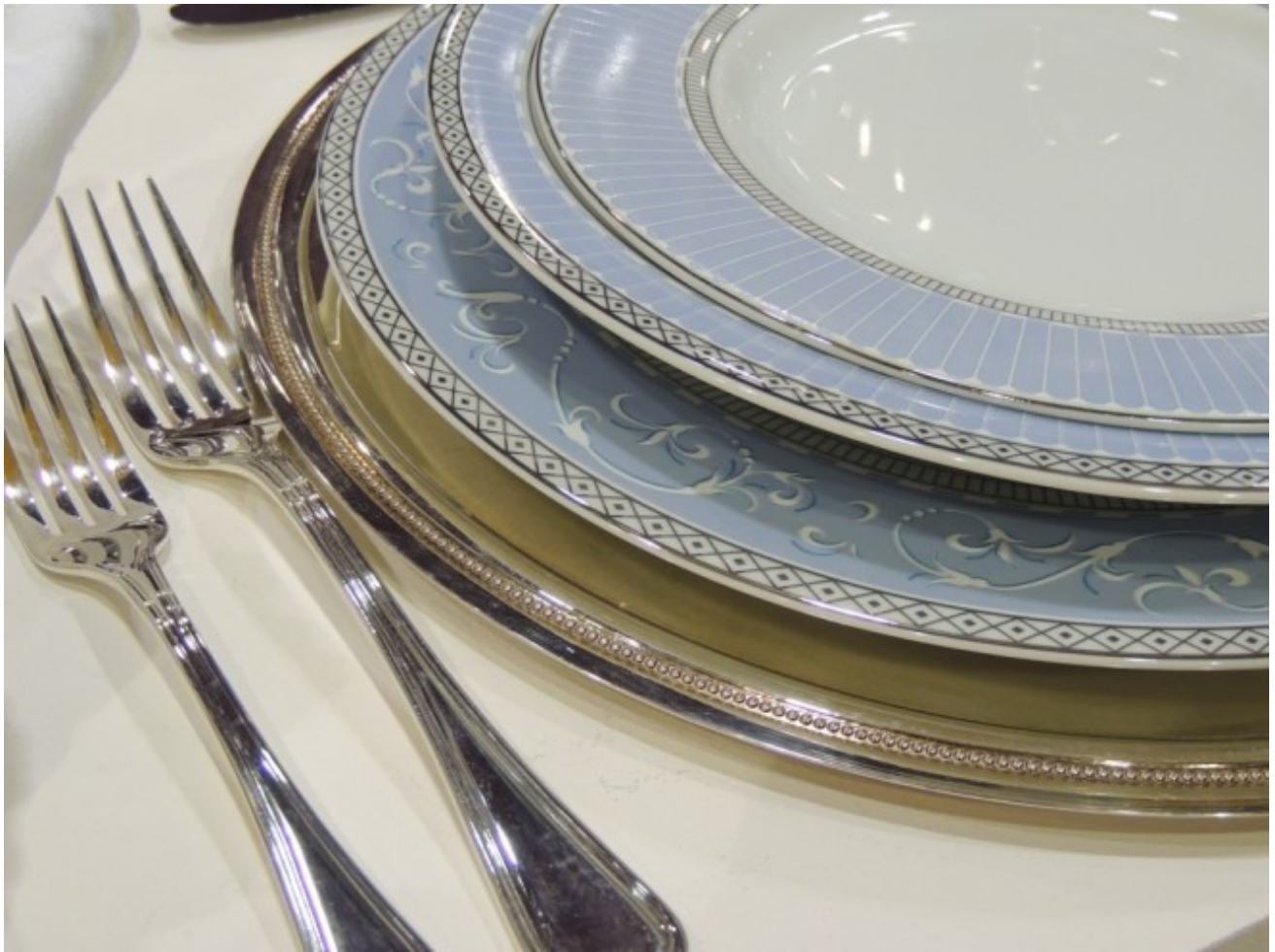
Porcelana Schmidt – linha exclusiva Diva