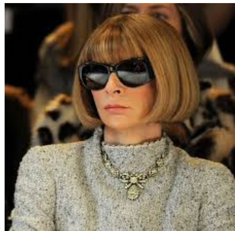
A jornalista de Moda Anna Wintour