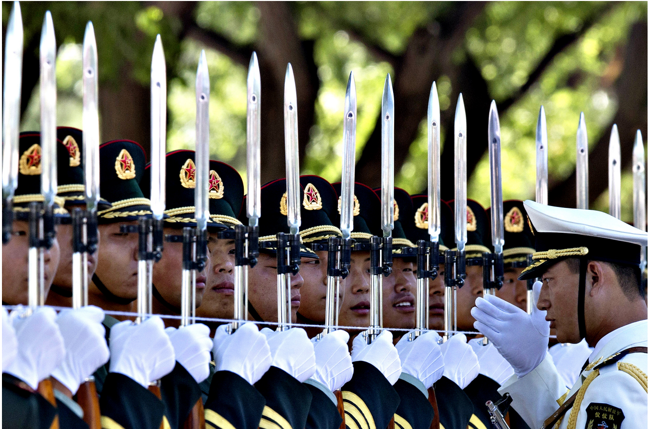
Members of a guard of honor prepare for a welcome ceremony for Pakistan Prime Minister Nawaz Sharif, unseen, outside the Great Hall of the People in Beijing, China, Friday, July 5, 2013.