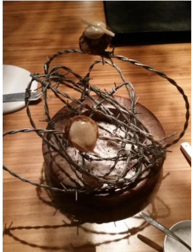
Como se chega nesse bolo?

Há comida que vem apresentada em um sapato de alumínio, pratos com os ingredientes dispostos em um skate – não há limite para o mau gosto.