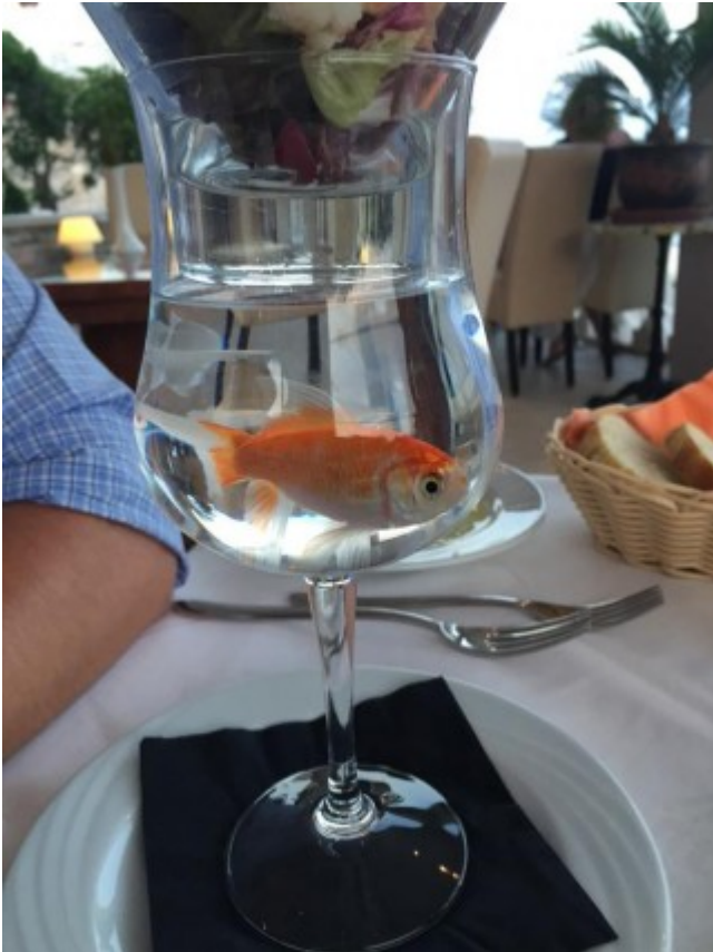
Suporte de coquetel de camarão: prá lá de anti ecológico!!