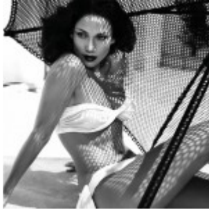
Jennifer Lopez em 1998

Sou chata? Mas quem falou que era fácil? Se conseguir incorporar pelo menos metade desses conceitos, já dá pra brincar de mulher elegante